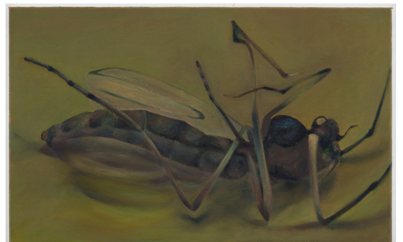
Mort, 2014, olieverf op linnen, 30 x 50 cm

Maar ook aan het verlangen, het bewustzijn en de stilte die al deze werken met elkaar verbindt.