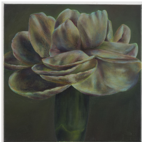
Little Orgasm, 2014 olieverf op linnen, 40 x 40 cm