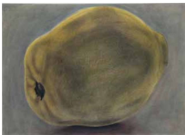
Nourishment I , 2016, gemengde technieken, 50 x 70 cm

steeds opnieuw verschillende associaties oproepen met zowel angst en verlangen. Ze eisen je aandacht op, misschien in ruil voor de geheimen die ze lijken te bevatten maar die ze nooit eenduidig zullen prijsgeven.