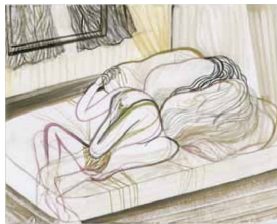
Another Tongue Lovers Lisbon , 2011 aquarel en gouache op papier, 23,9 x 29,9 cm

gedachtewereld die tegelijkertijd voor iedereen zou kunnen gelden. En misschien ook wel voor de kijker zelf.